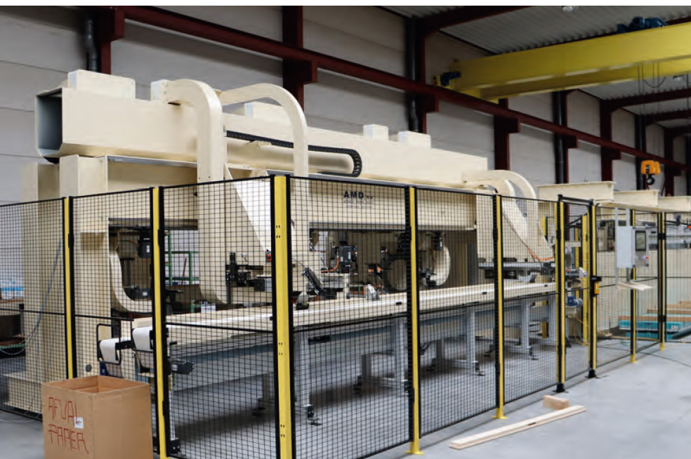
Die Maschine für die blitzschnelle Herstellung von kompletten Bausätzen für Blockhäuser und Gartenhäuser.

In Flandern gibt es einen Maschinenhersteller, der in Fachkreisen sehr bekannt ist. Wer vor dreißig Jahren Holzmöbel herstellte, kam um AMD nicht herum. Und auch die Hersteller von Blockhütten und HSB-Elementen wissen, wo sie das Unternehmen in Roeselare finden können. Heute baut das Unternehmen auch Maschinen, mit denen sowohl sehr kleine Werkstücke als auch schwere Balken komplett bearbeitet werden können.